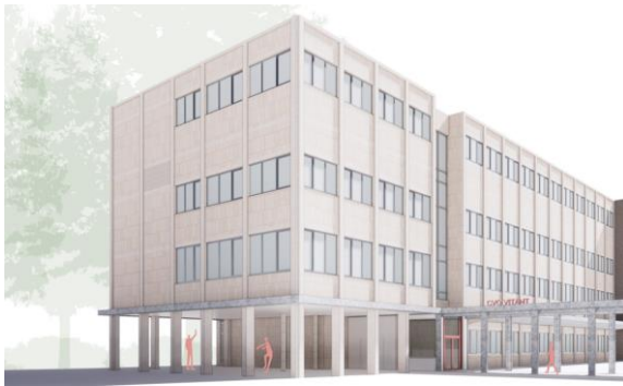
Nieuwbouw en renovatie CVO Vitant op PIVA

Zoals al aangegeven bij PIVA, is er een masterplan voor de site PIVA opgestart. Voor CVO Vitant houdt dat in dat het tweedekansonderwijs op termijn zal verhuizen. In 2022 werd de herinrichting en de aanbouw van de vleugel die voor deze opleidingen bedoeld zijn volop voorbereid. Het projectplan werd uitgewerkt samen met de architecten en DLOG. Ook werd de verhuis van NT2 naar het Lozanagebouw voorbereid. Deze plannen werden volledig uitgewerkt en grotendeels uitgevoerd.