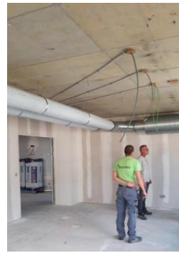
Verbouwing huisvesting NT2 Lozanagebouw